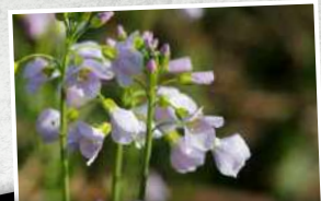
La cardamine des prés