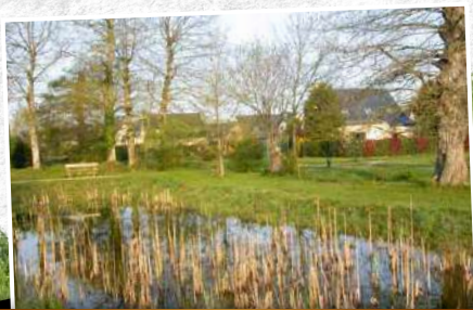
Aujourd'hui, les bassins de rétention communaux...