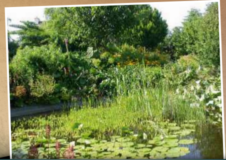
Plantations horticoles, 20 m 2 , esthétique, moyennement riche en biodiversité, création assez contraignante et onéreuse.