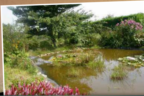
Plantations horticoles et sauvages, 50 m 2 , esthétique, riche en biodiversité, mais création contraignante et onéreuse.

On peut décider de creuser une mare pour des raisons esthétiques, écologiques ou autres. Et aussi selon son budget... Mais on peut aussi facilement concilier les objectifs. Une mare peut être à la fois jolie, attirante pour la faune sauvage, de taille très modeste et de conception peu onéreuse. Chacun agira selon ses envies, ses moyens et aussi ses talents ! Il faut enfin être réaliste. On ne pourra pas envisager une mare riche en biodiversité si l'on vit au milieu d'un océan de maïs ou cœur d'une cité bétonnée !