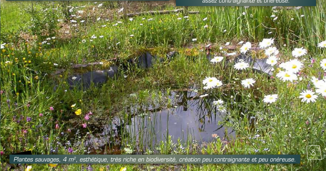
Plantes sauvages, 4 m 2 , esthétique, très riche en biodiversité, création peu contraignante et peu onéreuse.