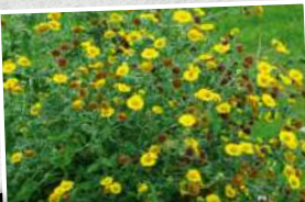
La pulicaire dysentérique