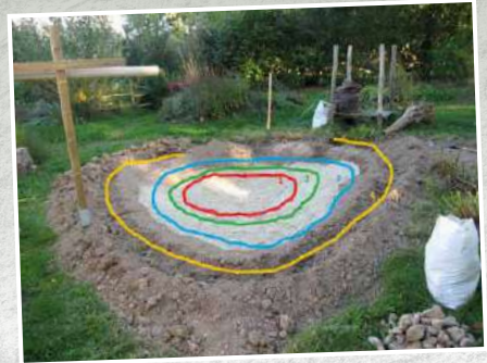
Coupe d'une mare