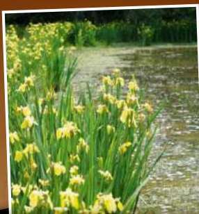
L'iris des marais