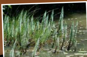
La pesse d'eau