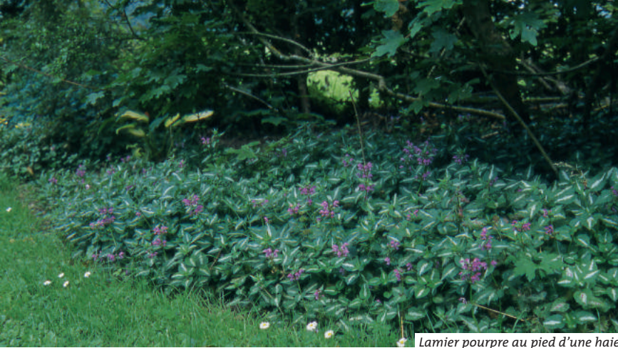
Lamier pourpre au pied d'une haie