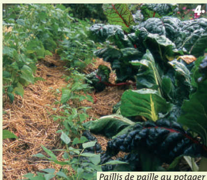
Paillis de paille au potager

Elle convient parfaitement pour les paillis annuels, au pied des légumes, des arbres fruitiers, des fraisiers, des framboisiers, des arbustes, des jeunes haies, en couche de quelques centimètres. Idéale au potager.