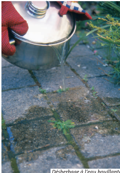
Désherbage à l'eau bouillante