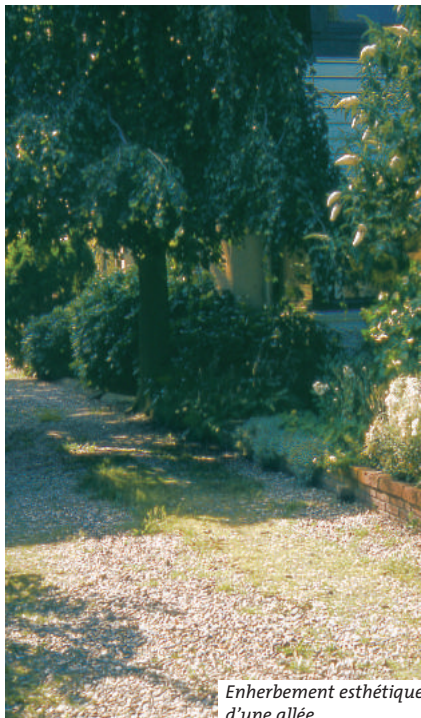
Enherbement esthétique d'une allée