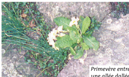
Primevère entre une allée dallée