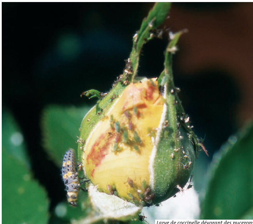
Larve de coccinelle dévorant des pucerons