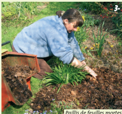
Paillis de feuilles mortes

Pour éviter leur éparpillement par le vent ou les oiseaux, conserver les branches basses des arbustes et étaler des écorces de pin de gros calibre en bordure.