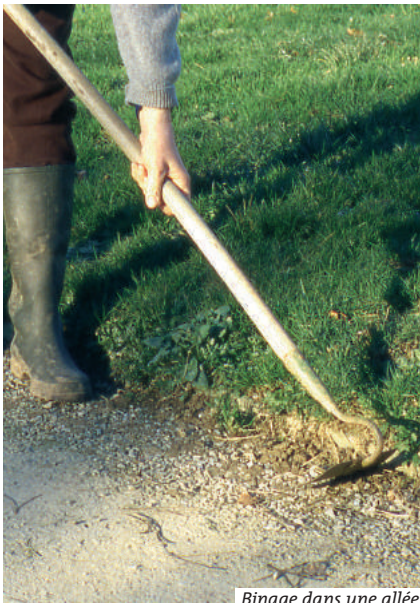
Binage dans une allée

Dans les surfaces gravillonnées ou en terre battue, couper régulièrement la base des plantes avec un sarcloir. Entre les dalles et pavés, couper les plantes au couteau.