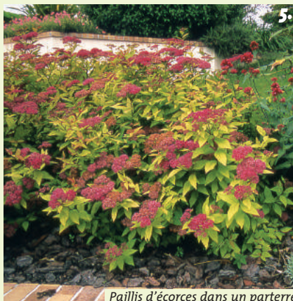
Paillis d'écorces dans un parterre

Elles possèdent parfois un effet dépressif sur les arbustes du fait des essences aromatiques et de la résine : à éviter sous les rosiers et les arbustes chétifs, exigeants en azote ou en calcaire. Les écorces de pin peuvent acidifier le sol, ce qui est favorable aux plantes de terre acide (azalées, hydrangea...). Pour éviter ce risque préjudiciable aux autres arbustes, apporter un peu de calcaire en surface (dolomie, chaux magnésienne) au bout de quelques années.