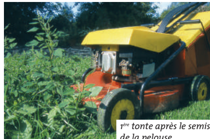
1 re tonte après le semis de la pelouse

La présence d'herbes sauvages sur la pelouse n'est pas un signe de négligence ou de manque de savoir-faire. Les petites plantes basses qui s'installent peu à peu dans l'herbe ont souvent une jolie floraison (pâquerette, véronique, brunelle, bugle...) et sont utiles pour nourrir les insectes auxiliaires.