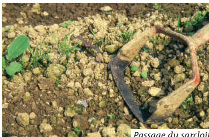
Passage du sarcloir

CONSEIL : Sarcler de préférence le matin d'une journée ensoleillée. Ne pas attendre que les « mauvaises » herbes soient trop développées ou en fleurs.