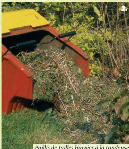
Paillis de tailles broyées à la tondeuse