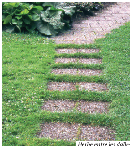
Herbe entre les dalles