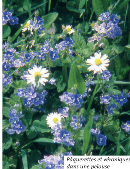
Pâquerettes et véroniques dans une pelouse

CONSEIL : Après le semis de la pelouse, il est fréquent que des plantes sauvages annuelles (qui ne vivent qu'un an) s'installent. Elles seront éliminées dès la première tonte. L'usage de désherbant sélectif peut se justifier seulement dans le cas d'une installation massive de mauvaises herbes vivaces (rumex...) : un seul passage suffira à les éliminer définitivement.