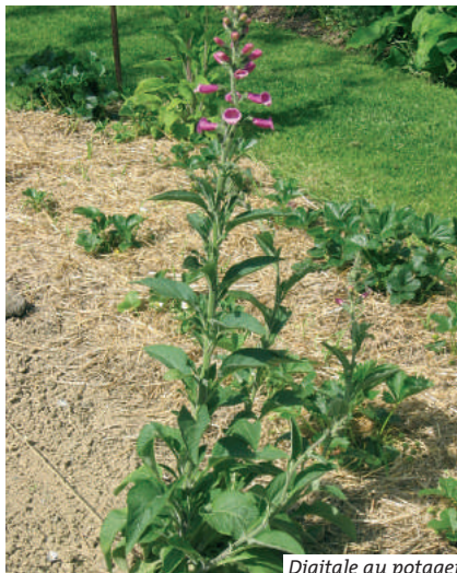
Digitale au potager