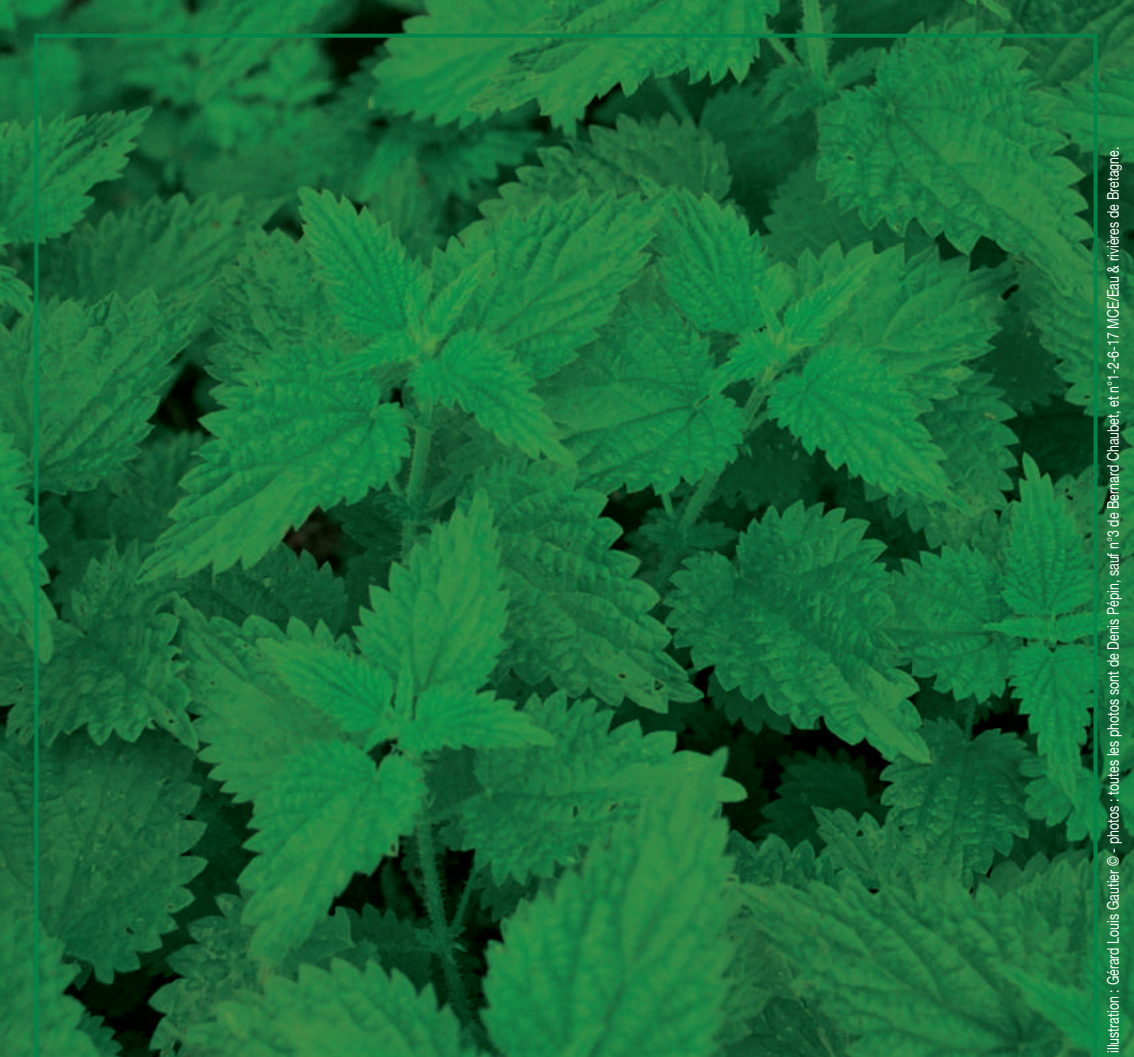
Illustration : Gérard Louis Gailler ©