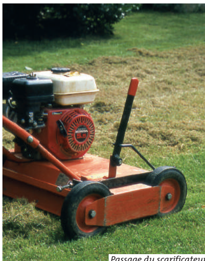
Passage du scarificateur

La mousse ne se montre envahissante que dans certaines conditions : stagnation d'eau en surface, souvent suite au tassement du sol, acidité, gazon inadapté à l'ombre, tonte trop courte.