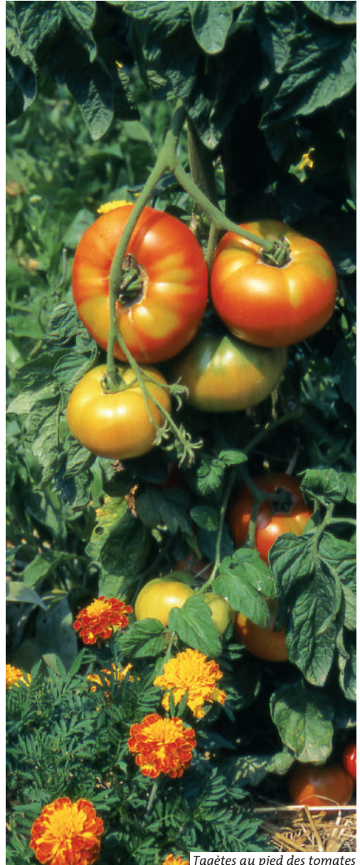
Tagètes au pied des tomates