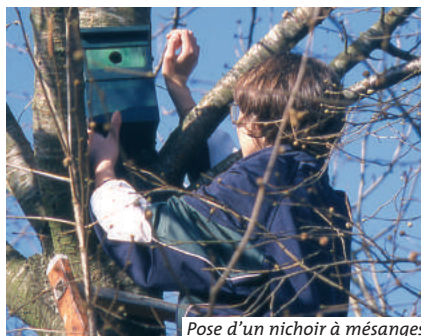
Pose d'un nichoir à mésanges

pour les oiseaux : buis, houx, laurier-tin, noisetier, sureau noir, cornouiller mâle, nerprun alaterne, viorne obier, charme, érable champêtre. Laisser le lierre couvrir la base des haies.