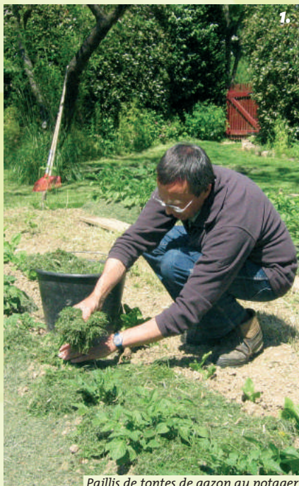
Paillis de tontes de gazon au potager